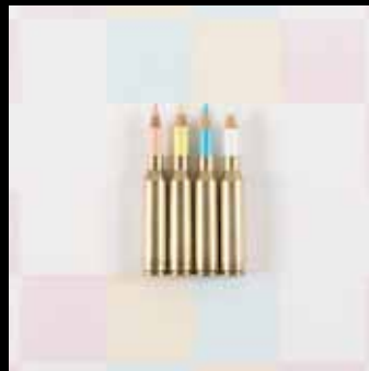
DELL'ARTE DELLA PACE Sabrina Bertolelli - Tecnica mista su tela, 60x60 cm, 2014 CONTEMPORARY-FLOWER...! Sabrina Bertolelli - (silver, green, red, blue, yellow, purple, orange, metallic green, black) - Installazione

Gran parte delle opere fanno parte del movimento artistico Estetica Paradisiaca fondato dal noto critico d'arte Daniele Radini Tedeschi e riconosciuto attraverso la conferenza alla Camera dei Deputati (Palazzo Montecitorio) il 18 marzo 2016 ed esposte nella mostra antologica sull'Estetica Paradisiaca, allestita presso il Museo Fondazione Venanzo Crocetti a Roma, curata dalla Dr.ssa Stefania Pieralice. Dicono di lei: "Artista votata alla costante ricerca di progresso e perfezionismo stilistico, Sabrina Bertolelli combina tra loro tecniche e materiali diversi, conducendo una sperimentazione sempre aperta agli