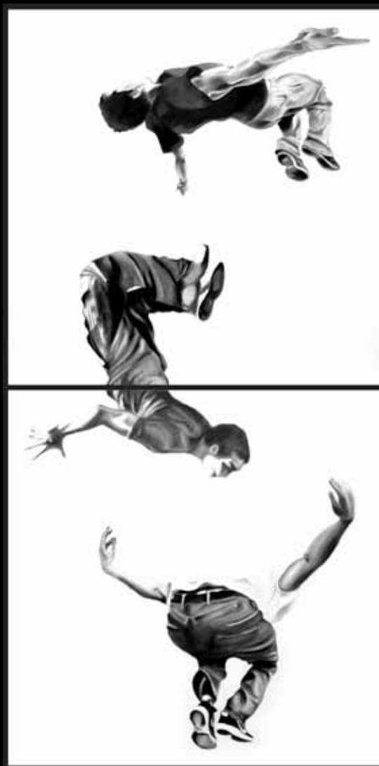
Silvia Caimi - MULTI JUMP 2 Sequence, olio su tela, 100x200 cm, 2017