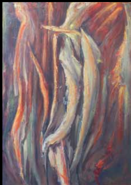
Fiamma Morelli - MONOLOGO, acrilico su tela, 70x50 cm, 2016