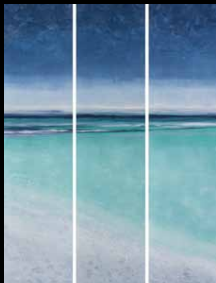
Alessandro Trani - Omega paradiso (trittico), tecnica mista, 80 x 60 cm, 2015