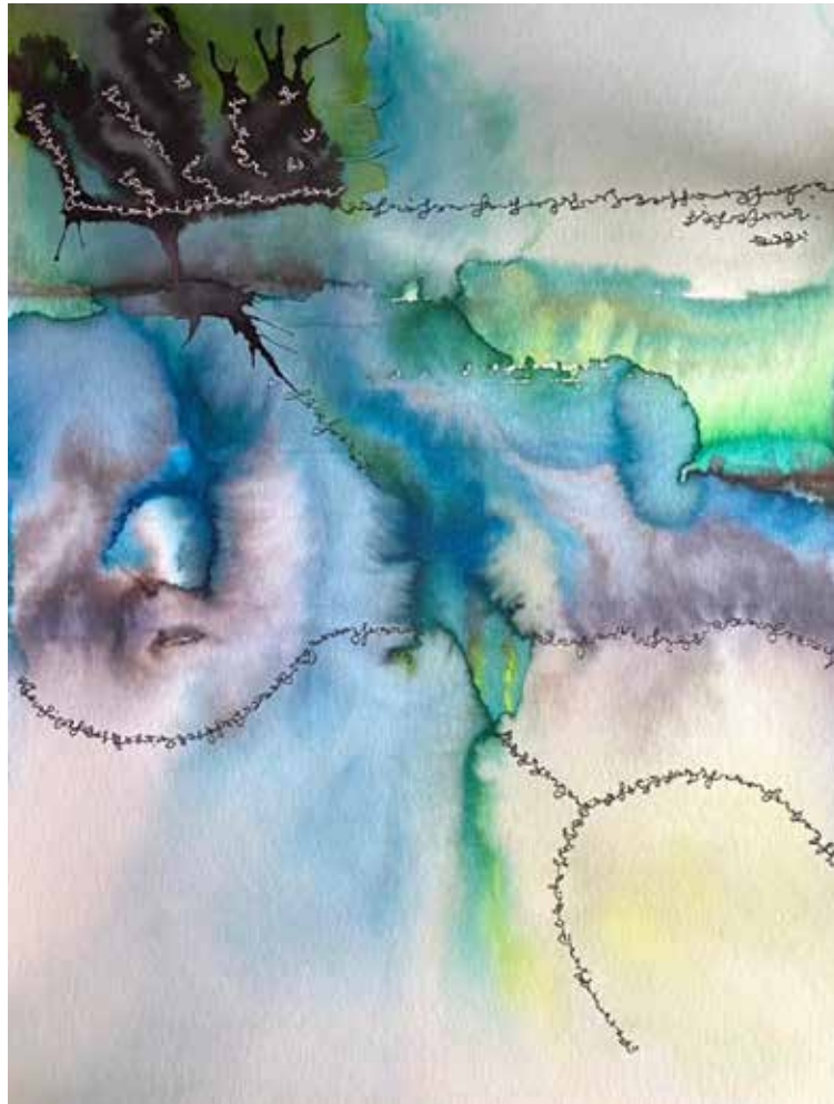
BLABLABLA Watercolor 85x60 cm 2022