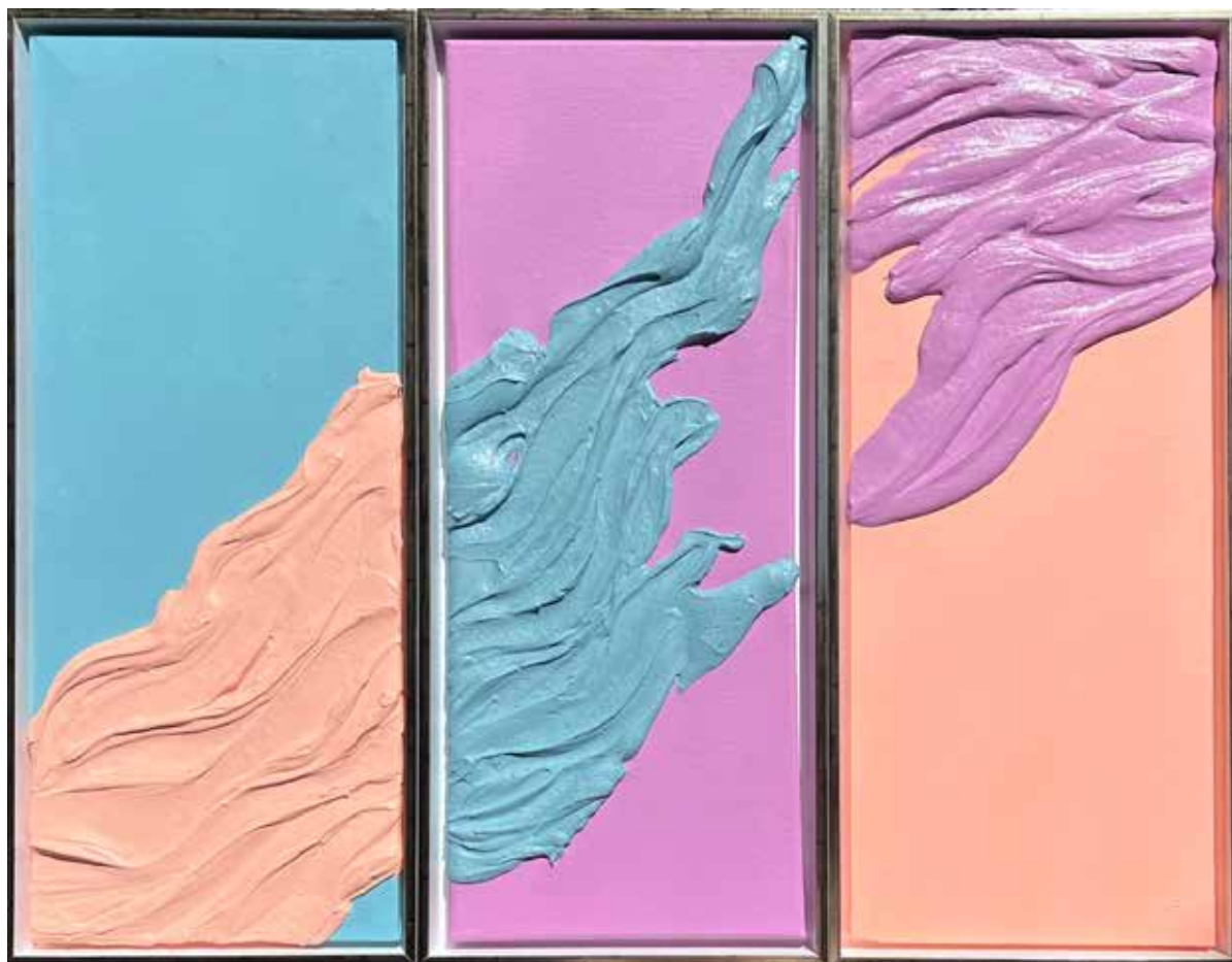
FUEGO Mixed media on Canvas 60x50 cm 2023