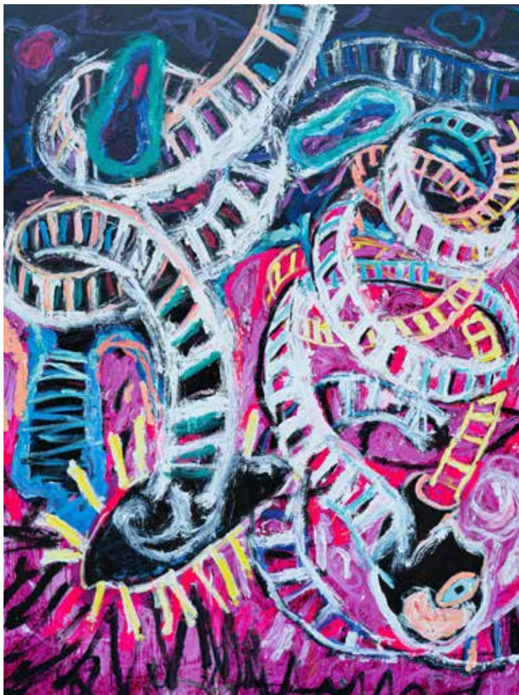
LINK (3) Acrylic on Canvas 160x200 cm 2020