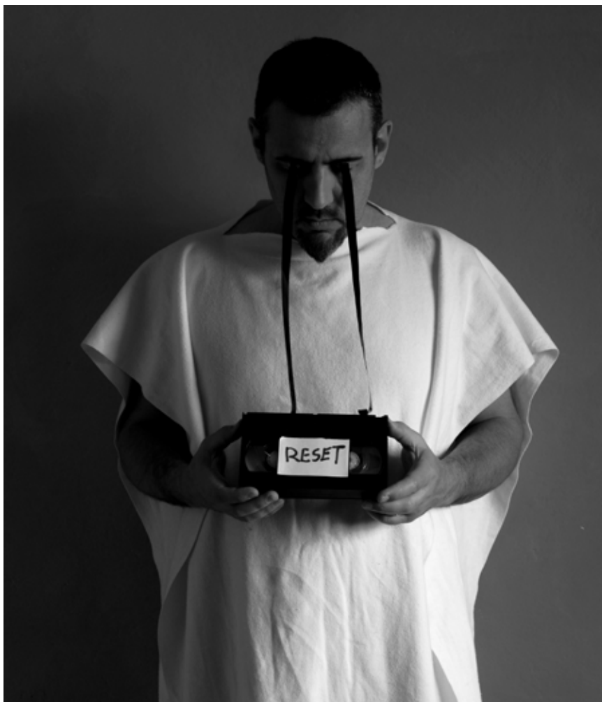
RESET Fotografia 50x70 cm 2017