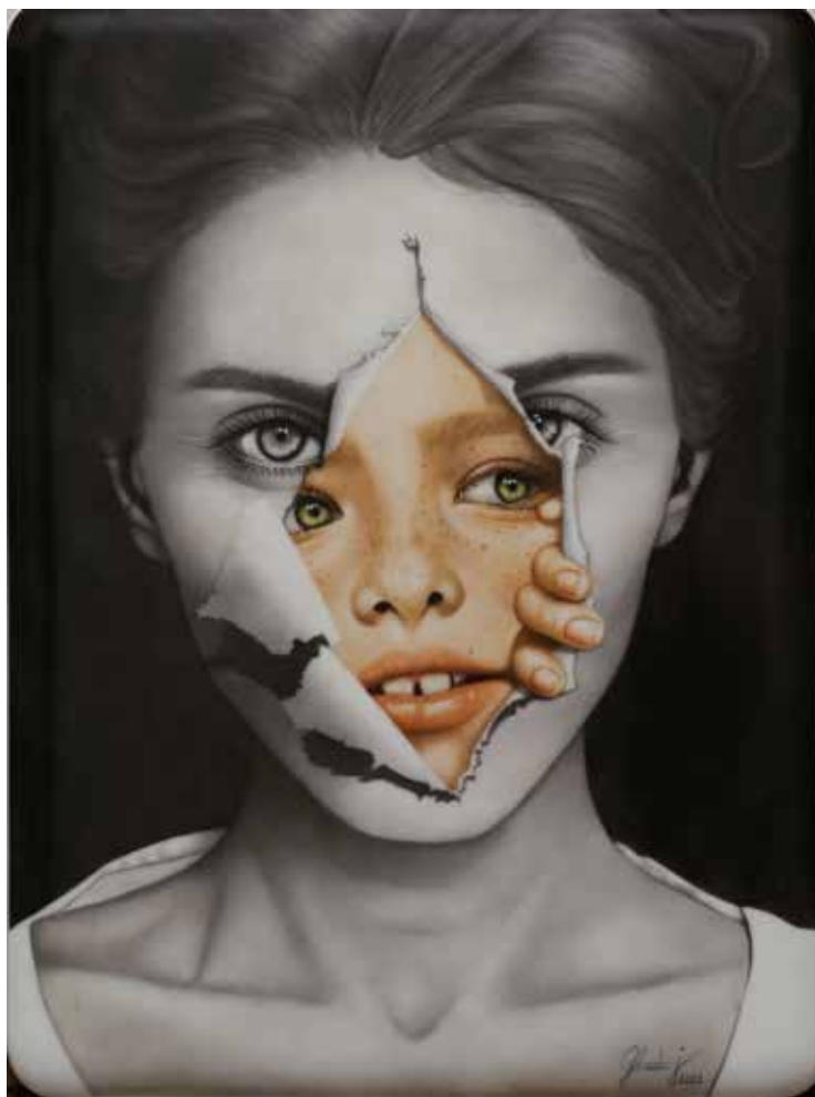
THE INNER CHILD Oils on porcelain 40x30 cm 2022