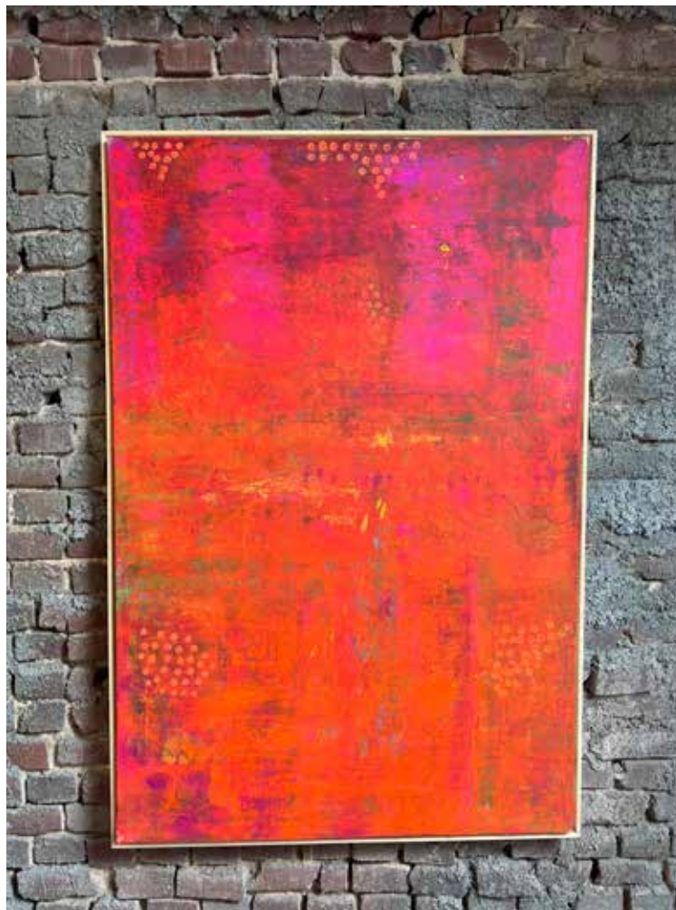
FALLING PINK Mixed media on canvas 150x100 cm 2022