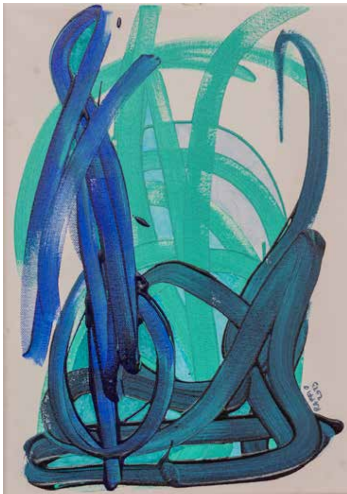
L'INCONTRO Acrilico su tela 30 x 40 2023