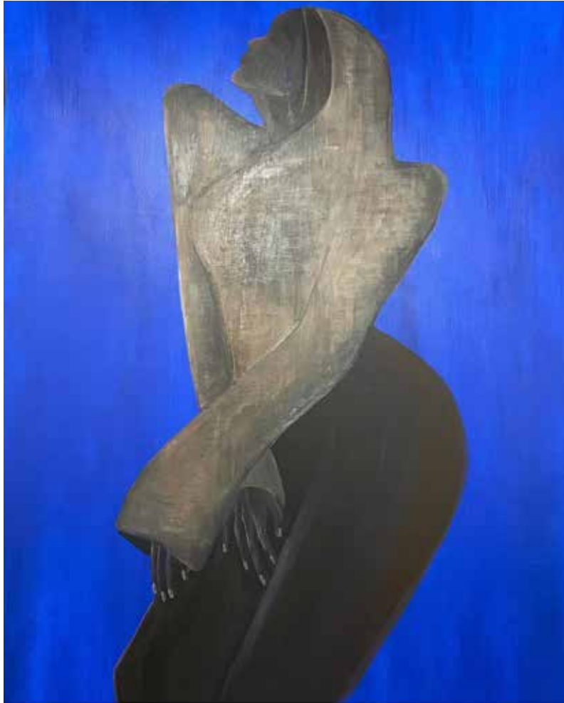
LACRIMOSA Acrylic on linen 140x200 cm 2023