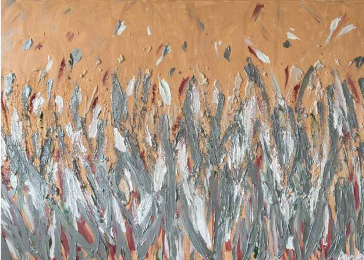
FLARE-UP Acrylic on canvas 100x70 cm 2022