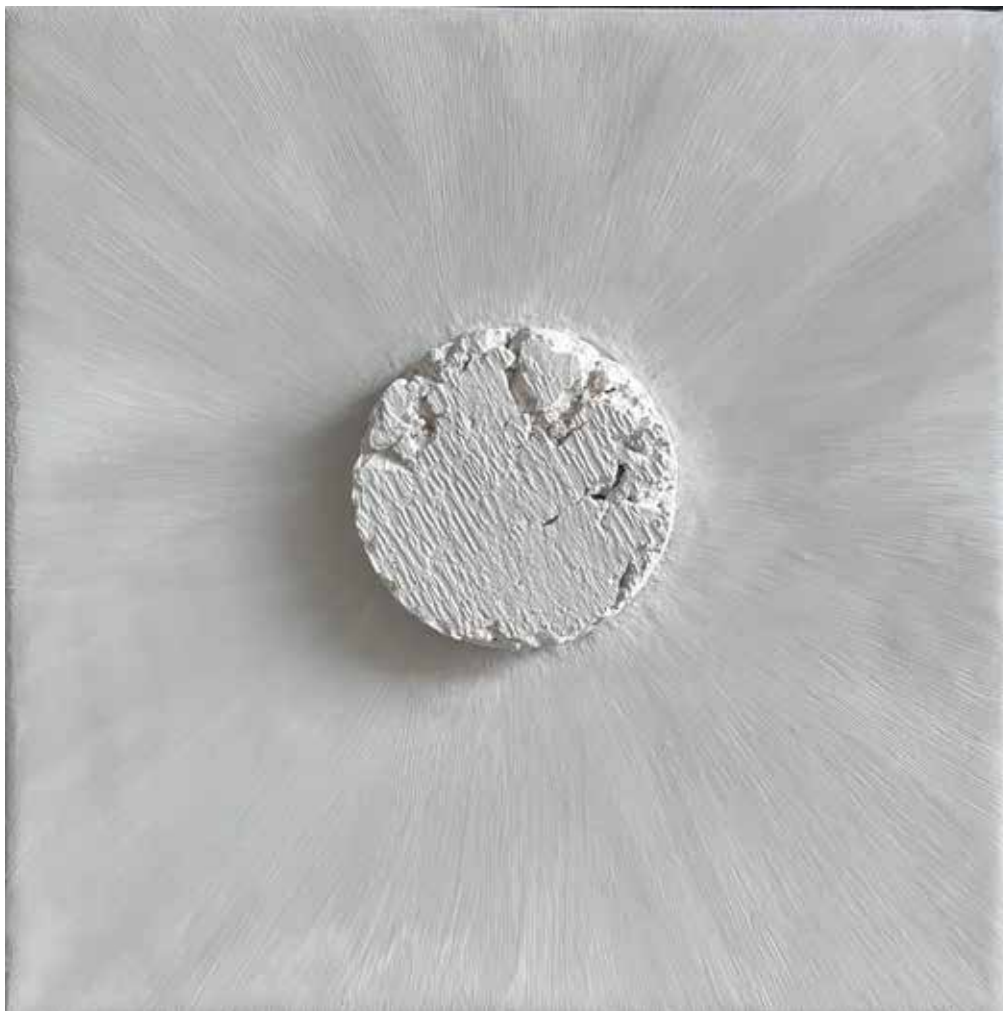
DELICATE Mixed media 30x30 cm 2023