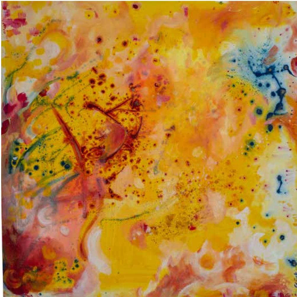
DAS GLÜCK IN MIR - THE HAPPINESS IN ME