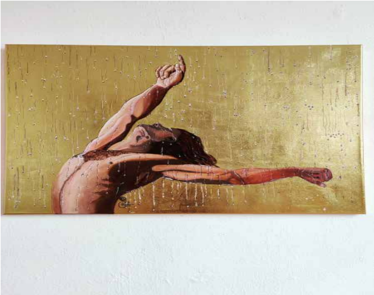
RAIN Acrylic on gilded canvas 100x80 cm 2023