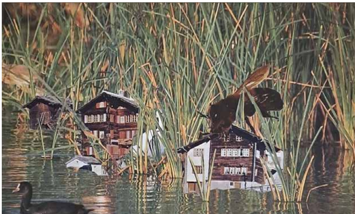
SERENITY Handmade Paper Collage 14x24 cm 2023