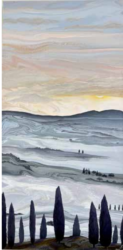
AURORA Embellished Landscape Pouring 100x50 cm 2023