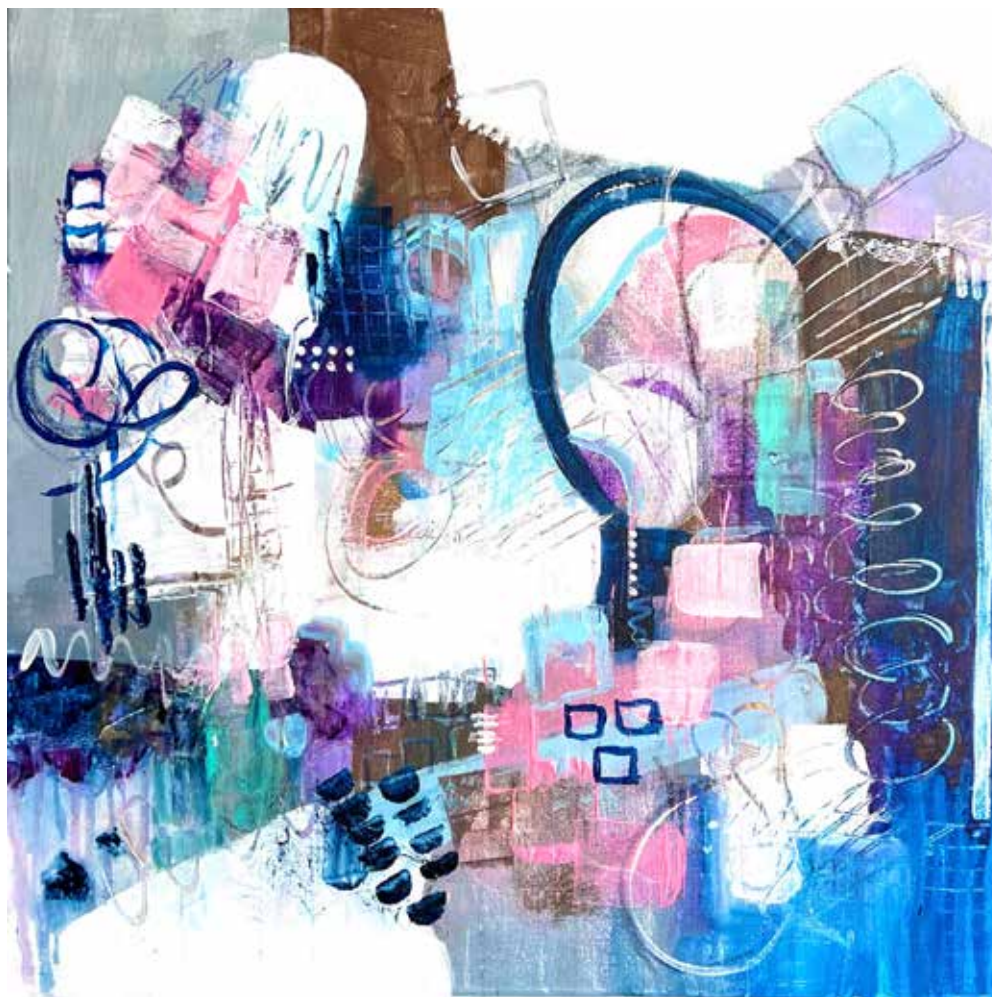
ENIGMAS Mixed media on canvas 50x50 cm 2023