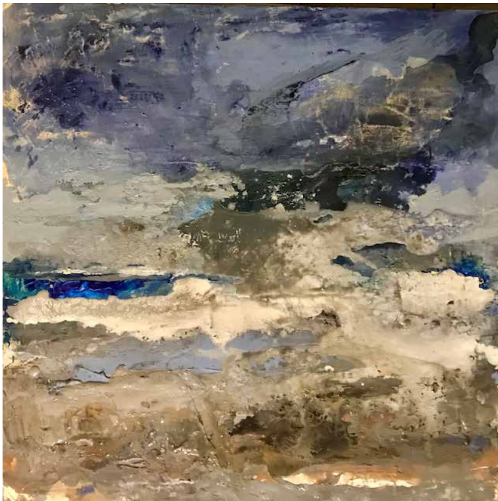
MARINA 21 Tecnica mista su tela 60x60 cm 2023