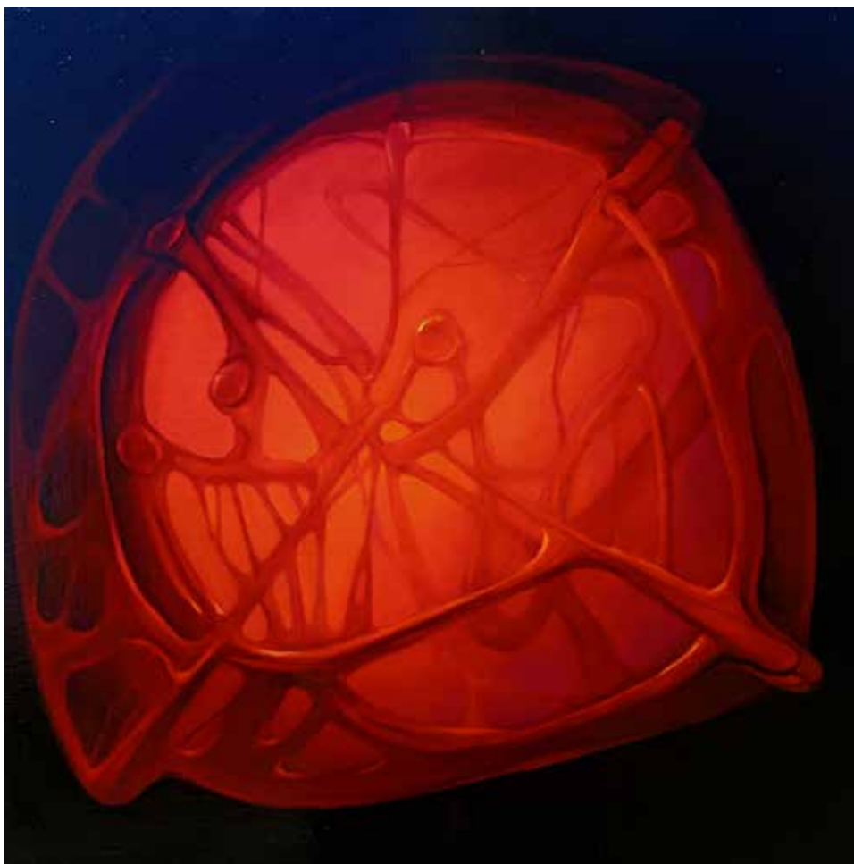
SERIES OF PAINTINGS "INSIGHT" NR 22, Oil on canvas 50x50 cm 2024