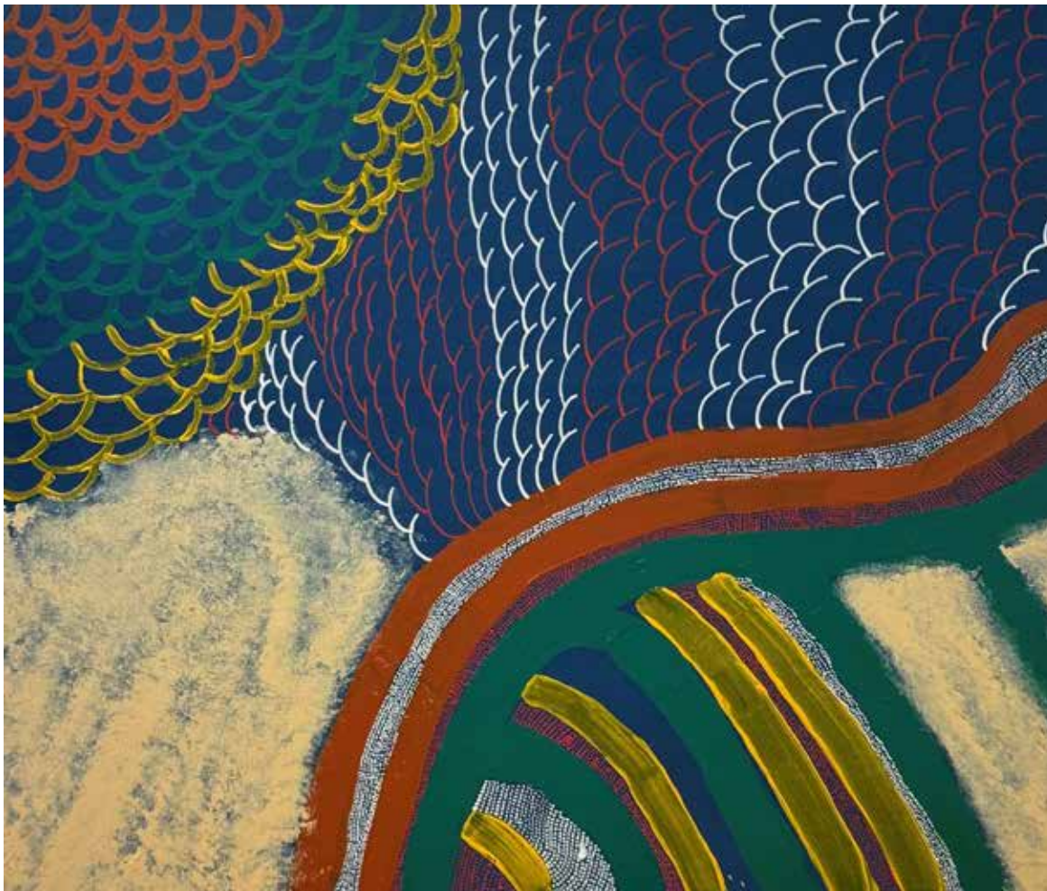
THE BEACH Acrylic paint and acrylic pen 50x60cm 2024